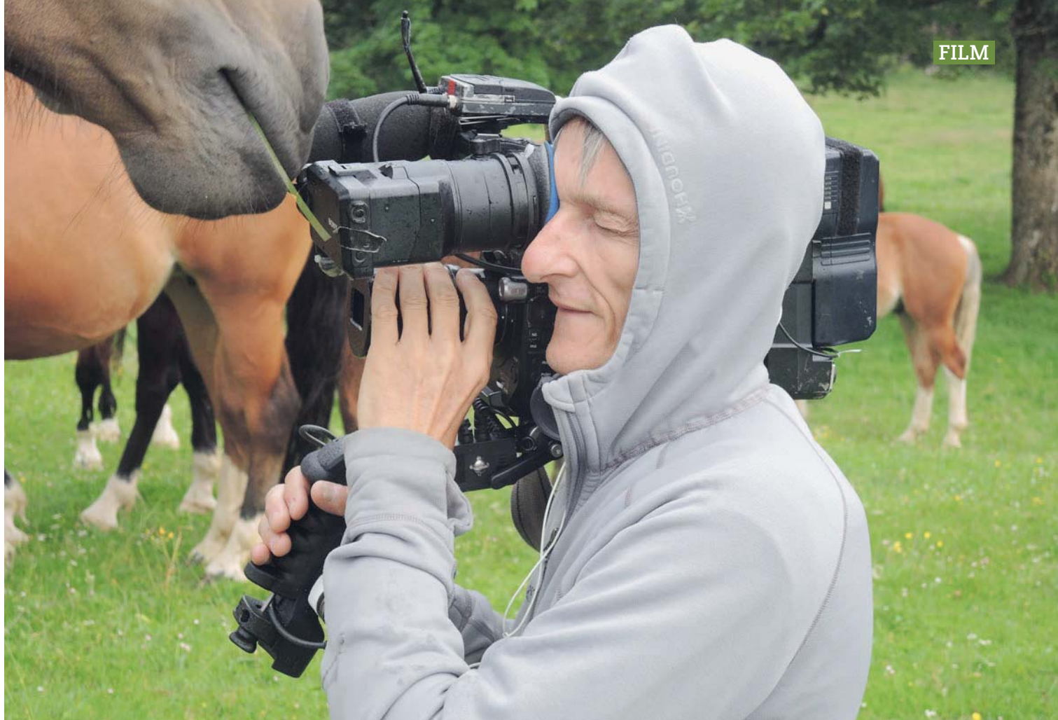
Retardé de quelques mois en raison de la pandémie, le tournage du film « Le Cheval de chez nous » s'est étalé sur une année. Von der Pandemie beeinträchtigt zogen sich die Dreharbeiten des Films " Le Cheval de chez nous " über ein Jahr hin.

sont très tendres au fond, mesure l'auteur, je montre une autre facette d'eux-mêmes, pas cachée non, mais qui se livre moins facilement. »